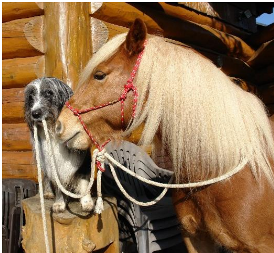
Haflinger Pedro y Waller Balu