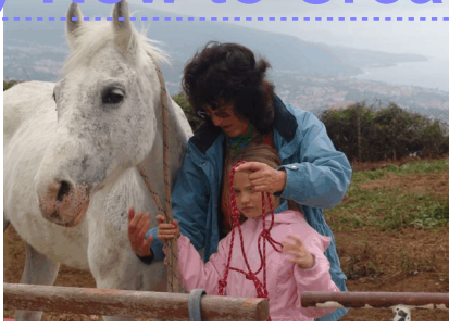
Niña aprendiendo a poner la cabezada.