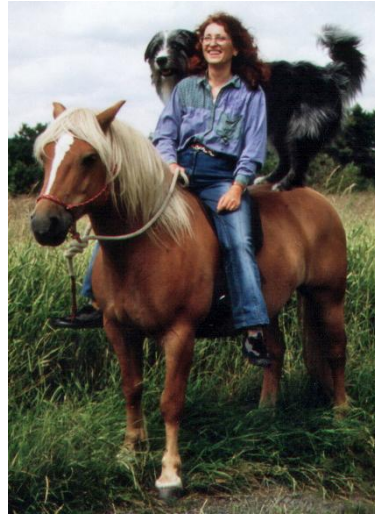
Haflinger ( nacido 1993)