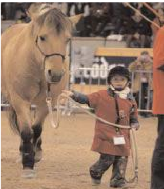
Nadie es demasiado pequeño para aprender el metodo Parelli.