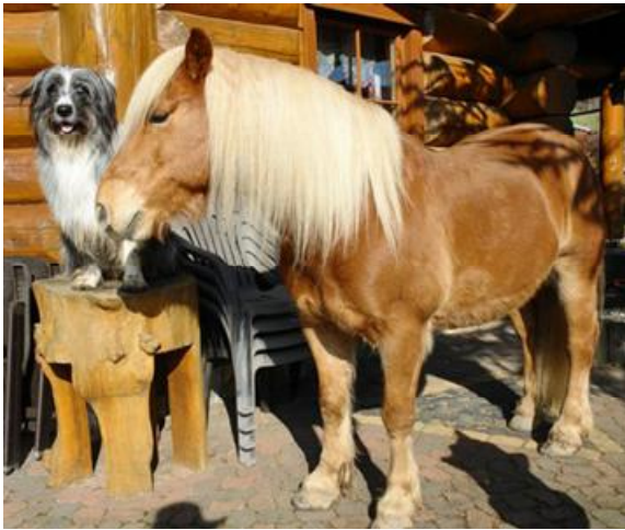
HAFLINGER "PEDRO" Y WÄLLER