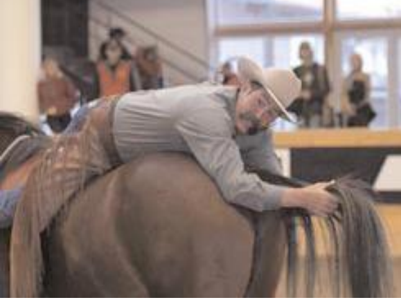
Pat Parelli. Divirtiendose y demostrando al publico su dominio de manera especial..... !!!fascinante!!!

Buy Now to Create PDF without Trial Watermark!!